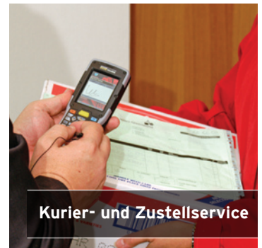
Kurier- und Zustellservice

Dieser Zigarettenanzünder Adapter mit 12–24V sorgt dafür das Ihr NEO unterwegs völlig aufgeladen wird. (Mit NEO Adapter PX3054).