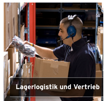
Lagerlogistik und Vertrieb